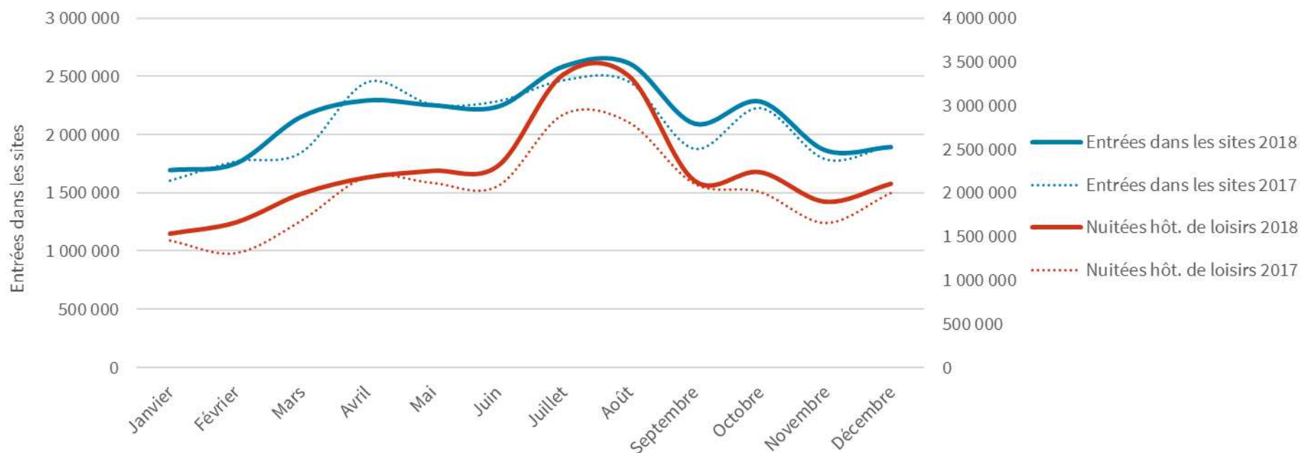
Saisonnalité comparée de la fréquentation des sites culturels/de loisirs 29 et des nuitées hôtelières de loisirs dans le Grand Paris (2017 et 2018)

La comparaison de la saisonnalité des nuitées hôtelières de loisirs dans le Grand Paris d'une part et de la fréquentation d'un panel d'établissements d'autre part permet de souligner les relations étroites qui lient culture et tourisme. Elle met en évidence la similitude des effets de saisonnalité et l'impact des événements/manifestations sur l'activité touristique de la destination.